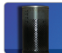
Diesel-Kraftstofffilter ohne PremiumDiesel ecoDrive nach 20.000 km

Ein Motor, der den Treibstoff effizienter und sauberer verbrennt, setzt auch weniger Emissionen frei und ist damit auch besser für die Umwelt. Und im Vergleich zu herkömmlichem Diesel bringt Sie eine Tankfüllung auch deutlich weiter.