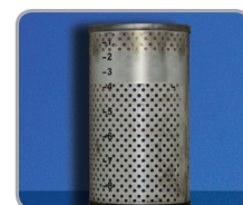
Diesel-Kraftstofffilter mit PremiumDiesel ecoDrive nach 50.000 km